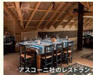
アスコニ社のレストラン

皮肉なことに1980年代のゴルバチョフ政権時の禁酒政策により、ブドウ畑の多くが消滅したが1990年以降ソ連の影響力の低下と共にワイナリーの民営化が始まった。現在でも大半のワインはロシアを含む旧ソ連国に輸出されているが、米国やEUの協力のもと旧来のロシア向け日常消費用ワインの生産から西ヨーロッパや米