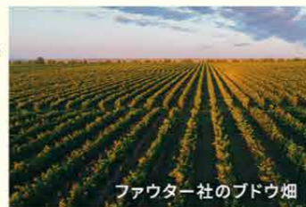
ファウター社のブドウ畑

国を輸出先とした高品質なワインの生産への転換が進められている。それに伴い、ワイン法の改正、原産地呼称制度の導入、ワインの品質やブドウ畑と全面的に管理するモルドバ ブドウワイン協会の設立などの政策が実施されている他、農業の削減や環境にやさしい慣行農法に国を挙げて取り組んでいる。