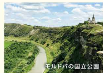
モルドバの国立公園

モルドバは1991年にソ連の崩壊と共に独立した若い国家で、主な産業は農業。ブドウ栽培とワイン醸造はその基幹産業に位置づけられている。黒海北西の南東ヨーロッパに位置し、面積は33,843km 2 と、日本の九州地方ほどである。